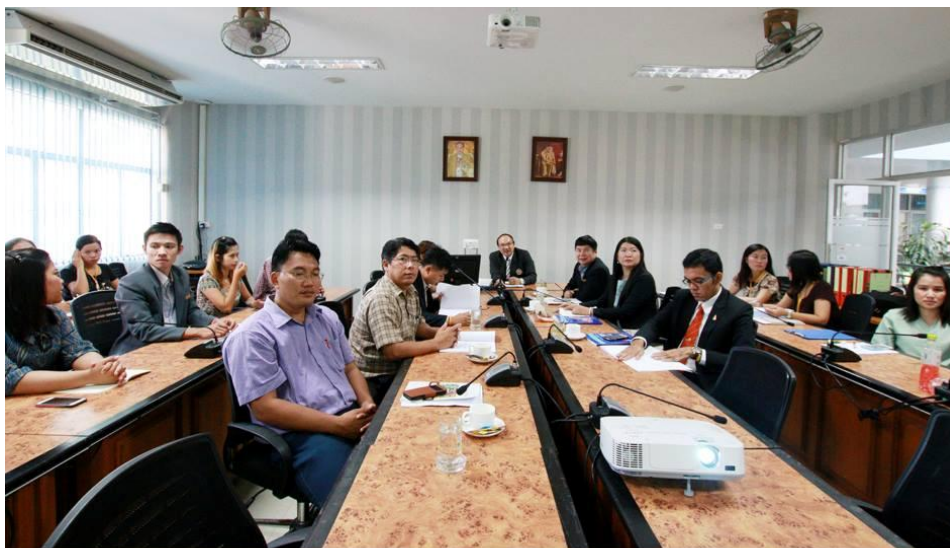
การประเมินคุณภาพการศึกษาภายใน สำนักศึกษาทั่วไป ปีการศึกษา 2557